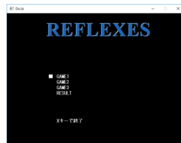
Fig. 2 Rhythm game

このゲームは、4つからなるレーンから印がランダムに落下してくる。印が画面下部にある赤いラインに到達したと同時にレーンごとに割り当てられた指定のキーを押すことで、また新たな印が落下する。この手順を繰り返すゲームである。このゲームの特徴は、これらは幅広い層の人を楽しんでもらえるように3種類のゲームモードが実装されている。活動は、主に毎週金曜日のミーティング後に行われた。メンバーの集まりが悪く完成度が満足行くものではなかったことが反省点として挙げられる。しかし、最終的には期限までに完成させることができた。リズムゲームのプレイ画面を図2に示す。