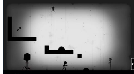
Fig. 1 Horizontal scroll action

本ゲームは敵の攻撃や障害物を避けながら、ゴールに向かってゲームである。独特なグラフィックにより、雰囲気でも楽しめる。当初の予定と比べ、操作性や設定など大幅に変更したが、結果的には納得のいくゲームとなった。ゲーム制作については、メンバー間でのコミュニケーションが少なく、そのため制作に遅れが生じた。横スクロールアクションのプレイ画面を図1に示す。